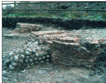
RUE - Bastion Saint Jean - décembre 2004 Découverte des fondations des fortifications.

E-mail : officedutourisme.rue80@wanadoo.fr www.rue-baiedesomme.com